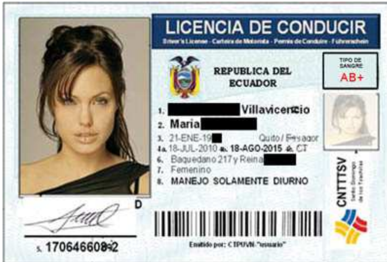
Modello 6 - Fronte - Repubblica del Ecuador - Da 2010