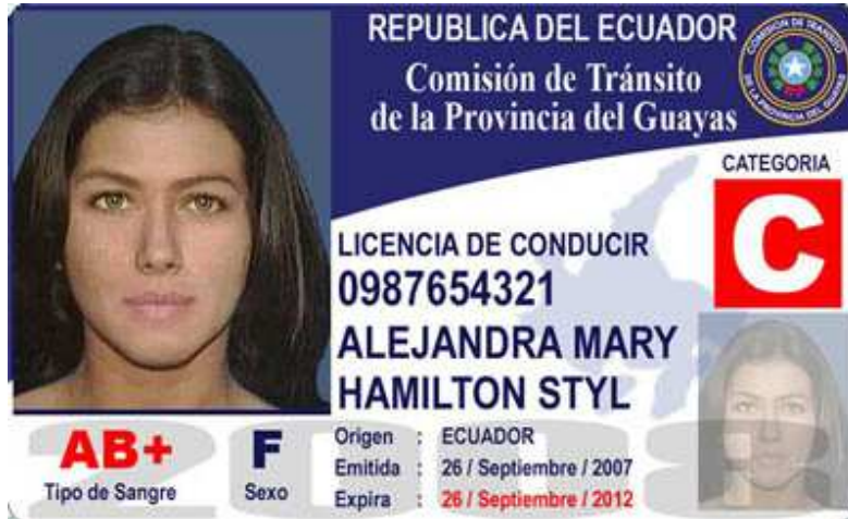
Modello 5 - Commissione di Transito provincia del Guyas - Da 2007